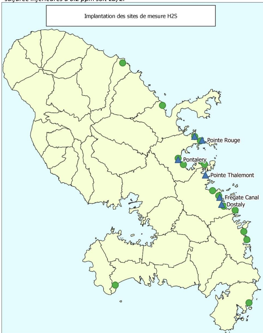
Implantation des sites de mesure H2S