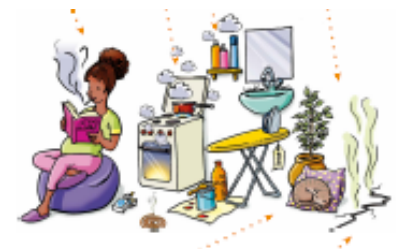
La pollution intérieure