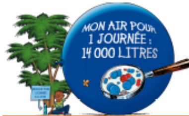
Nos besoins journaliers en air