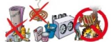
La pollution de l'air : Que faire ?