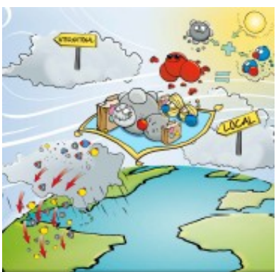
La circulation des polluants