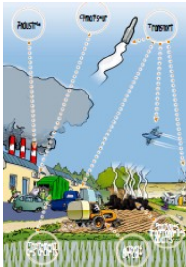
L'homme principal pollueur