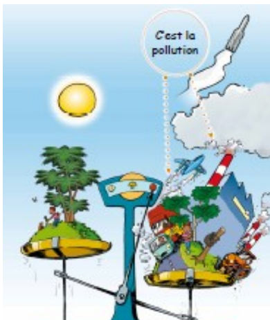
La pollution de l'air